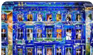
„Powroty” artyści poprzednich edycji LMF