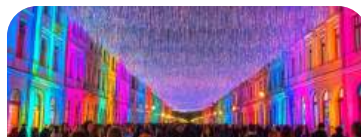
„Pod baldachimem gwiazd” Fundacja Lux Pro Monumentis