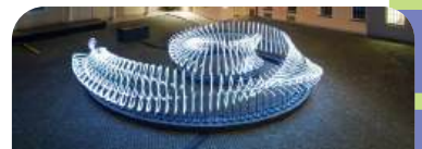
„Flux” Collectif Scale