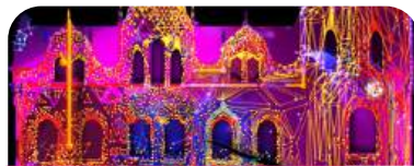
„Wiry” Kurbas Production